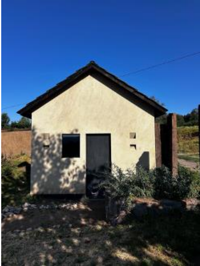
CASETA DE VIGILANCIA