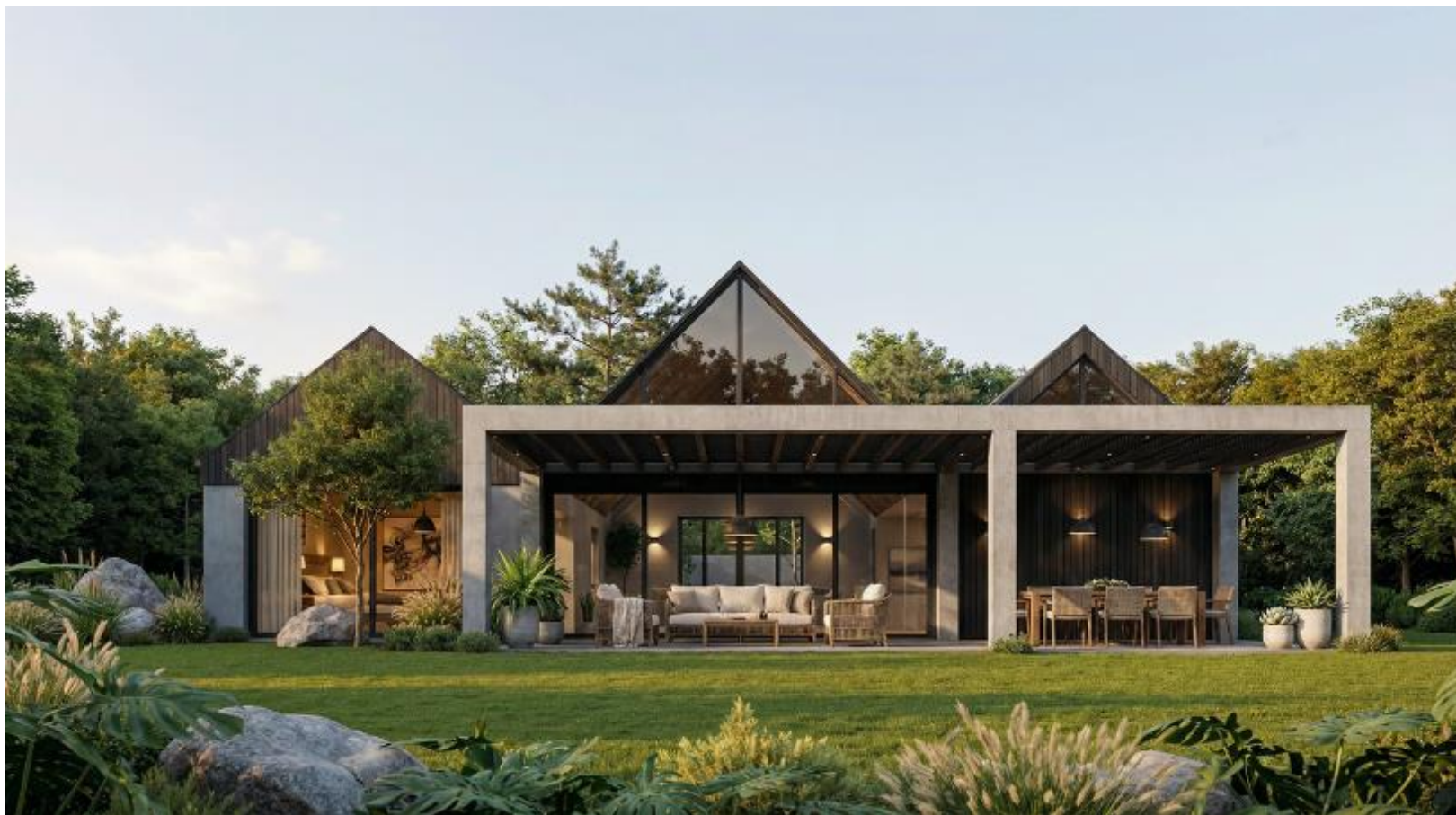
RENDER. FACHADA AL JARDIN