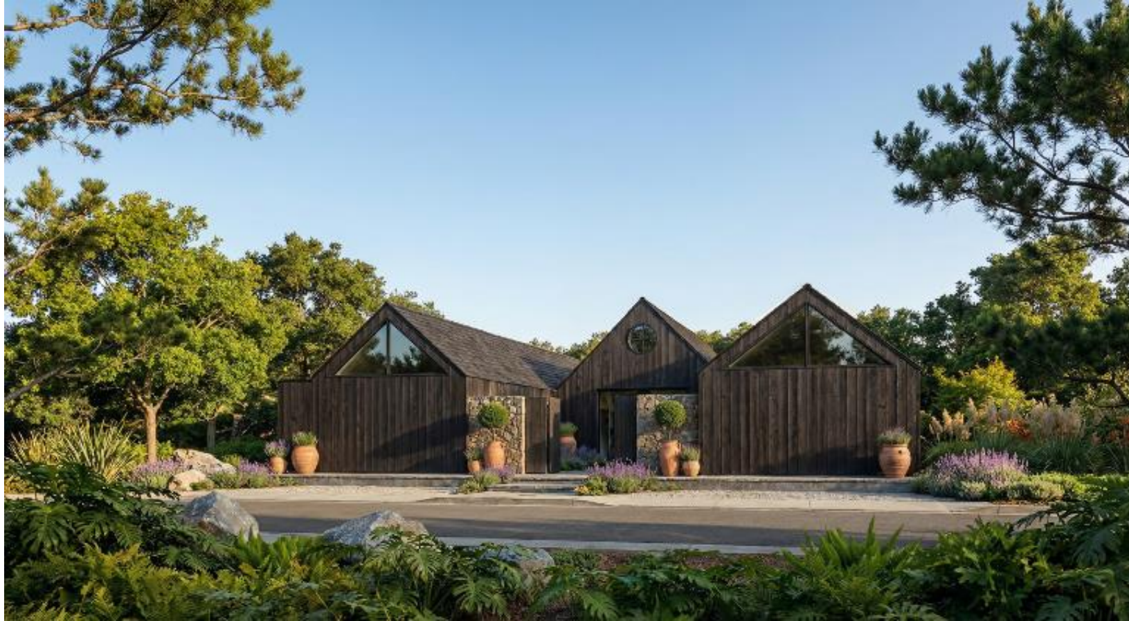
RENDER. FACHADA FRENTE